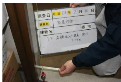
【新築時近隣家屋調査】

2011年新生工業株式会社と株式会社タケソウが合併致しまして、さらに幅広い工事の施工が可能になり、従来の外壁工事はもとより、内装工事・美装・近隣家屋調査（家屋調査公証役場申請）等色々なニーズにお答え出来る様、日々邁進しております。